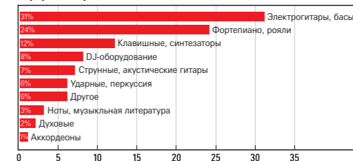
Сферы интересов посетителей NAMM Musikmesse Russia

*NAMM Musikmesse Russia и Prolight + Sound NAMM Russia